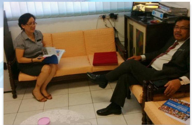
TKPPM bertemu dengan warga pendidik bagi membincangkan Pelan Pembangunan Pendidikan Malaysia (2013-2025)

Hasil kaji selidik yang dijalankan, terdapat jurang yang tinggi didalam peratus tahap kesedaran tentang kewujudan Pelan Pembangunan Pendidikan Malaysia 2013-2025 antara pengetua dan guru. Pengetua dilihat lebih memahami tentang matlamat dan aspirasi PPPM berbanding guru-guru di sekolah. Ini menunjukkan pentingnya pentadbir sekolah memainkan peranan bagi menatarkan maklumat mengenai Pelan Pembangunan Pendidikan Malaysia 2013-2025 dan meningkatkan kesedaran warga pendidikan terhadap aspirasi PPPM.